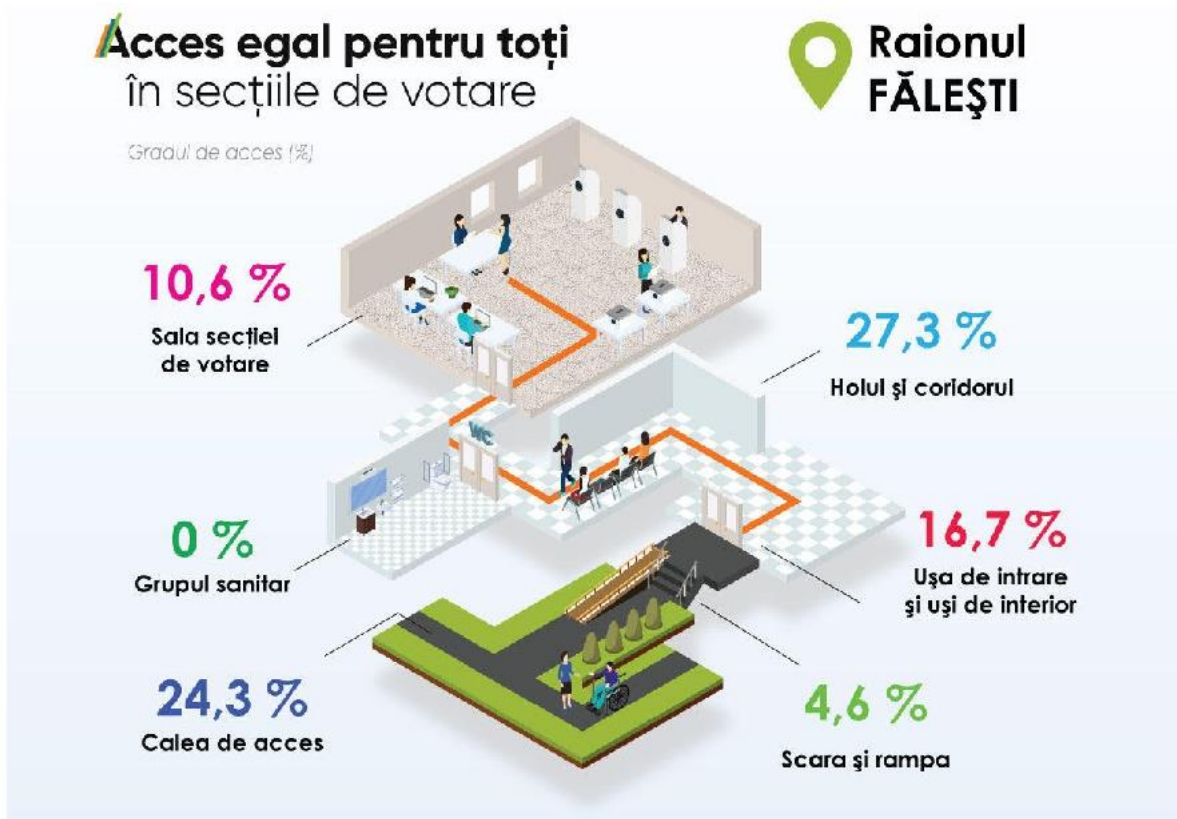
Tabelul 31. Sinteza rezultatelor evaluării clădirilor cu destinație publică în conformitate cu cele 6 criterii de evaluare în raionul Fălești. Total evaluate 66 secții de votare