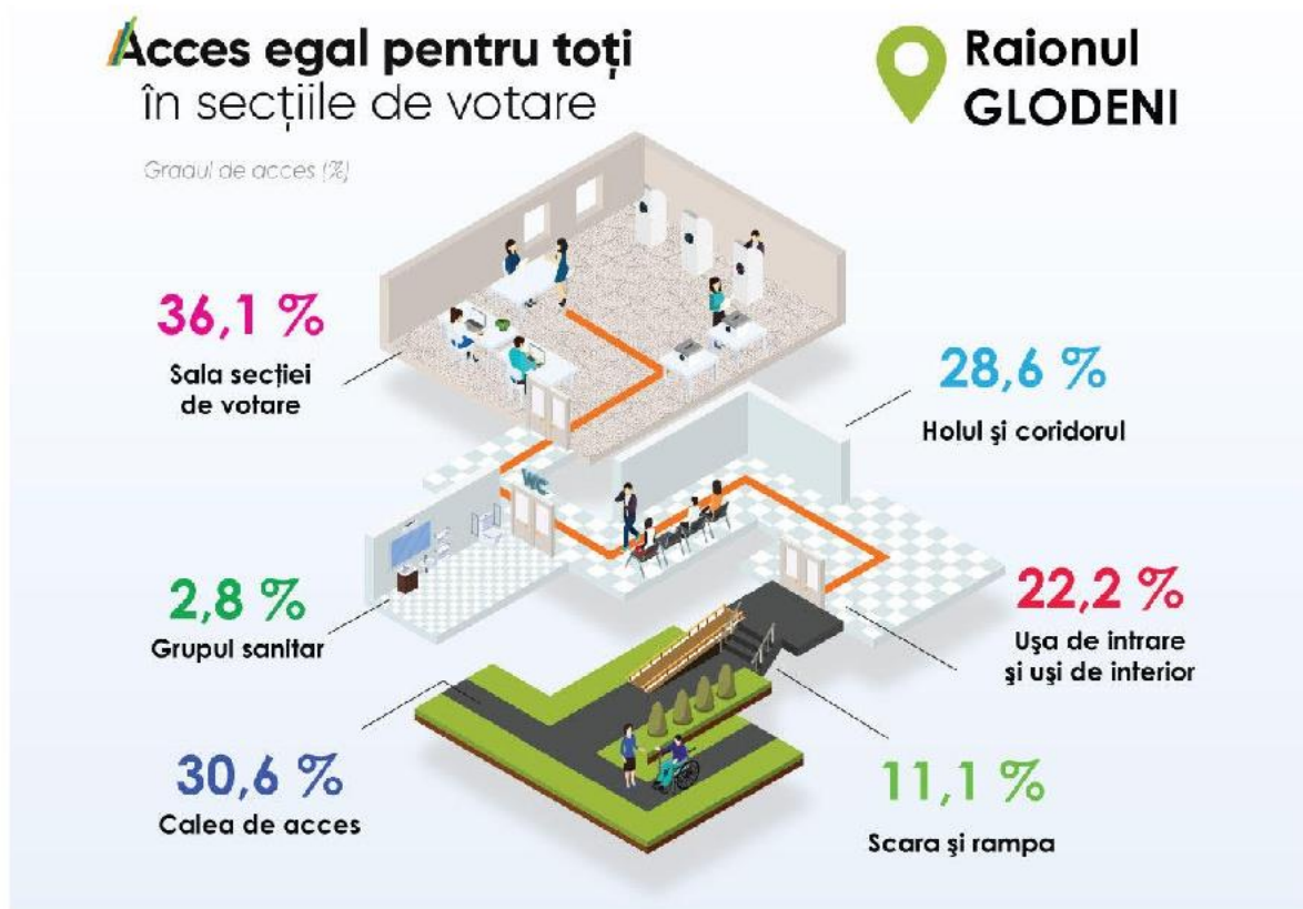
Tabelul 35. Sinteza rezultatelor evaluării clădirilor cu destinație publică în conformitate cu cele 6 criterii de evaluare în raionul Glodeni. Total evaluate 36 secții de votare