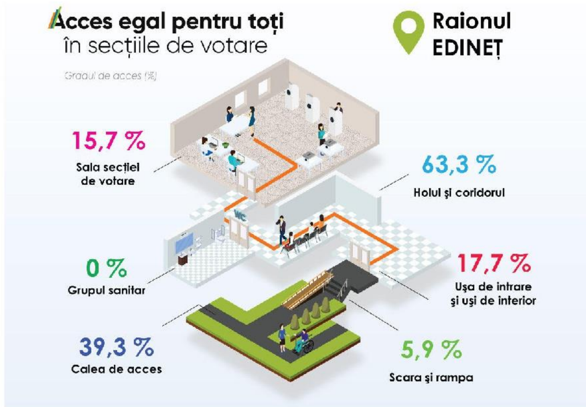
Tabelul 29. Sinteza rezultatelor evaluării clădirilor cu destinație publică în conformitate cu cele 6 criterii de evaluare în raionul Edineț. Total evaluate 51 secții de votare